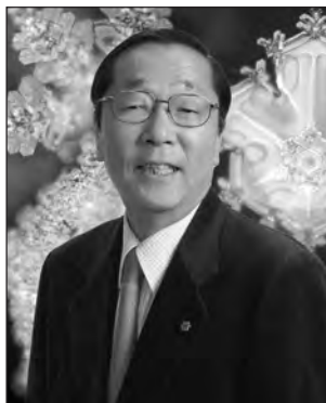
Masaru Emoto (1943-2014)

Care este principiul de bază al magiei* magnetice albe? După cum știm, pentru a capta*, spre exemplu, în aura* noastră energia* iubirii*, este necesar să ne „acordăm“ pe frecvența acelei energii*, care este emisă în mod continuu de un focar emițător dumnezeiesc. Dar cum ne putem acorda, atunci când noi nu cunoaștem acest sentiment al iubirii*? Aici intervine aspectul neutru al energiei* vidului*, care este, în felul său primordial, precum o sticlă topită ce nu a prins încă formă în mâna sticlarului.