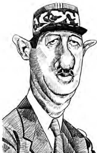
★Generalul Charles de Gaulle★

remarcabil. De exemplu, au circulat anecdote despre ticurile generalului de Gaulle 7 , se zvonea că se ducea noaptea pe malul unui lac din Bois de Boulogne 8 pentru a încerca să meargă pe apă, se pretindea că întotdeauna când îl întreba pe prim-ministrul Michel Debré 9 cât e ceasul, acesta răspundea imperturbabil: „Este cât vreți să fie, domnule general.”